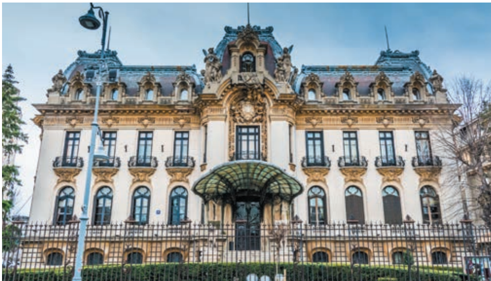
Muzeul Național „George Enescu”, București.